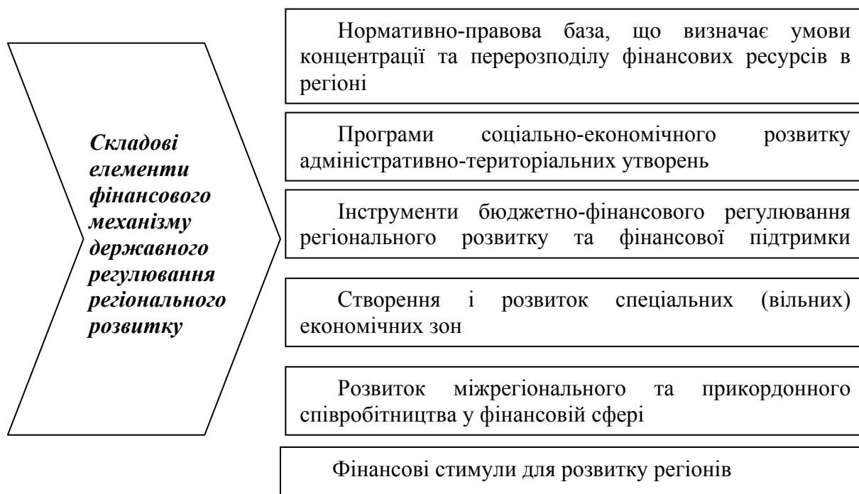
Рис. 13.1 Складові елементи фінансового механізму державного регулювання регіонального розвитку

Складові фінансового механізму розвитку регіону (див. рис. 13.1) формуються в залежності від умов його функціонування та призначення, особливостей рівня соціально-економічного розвитку та географічного розташування регіону.