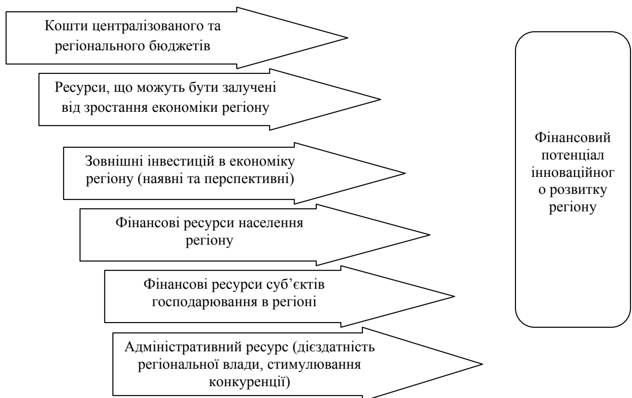
Рис 13.2 Складові потенціалу фінансового забезпечення інноваційного розвитку регіону

Зміст складових потенціалу фінансового забезпечення інноваційного розвитку регіону представлено на рис. 13.2.