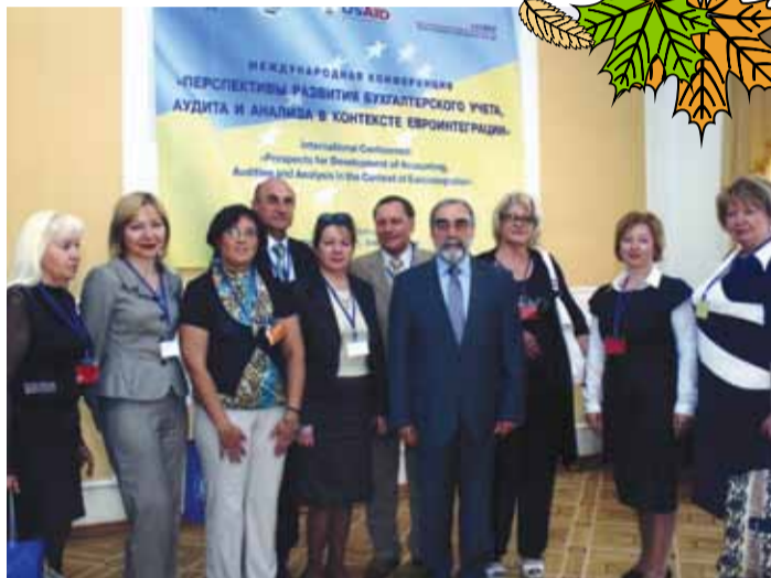
Учасники та організатори конференції